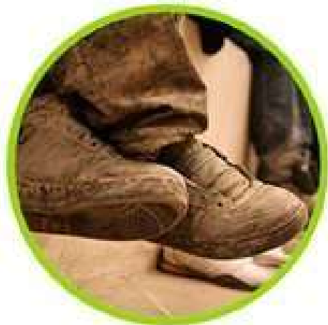
CALLE Y ADICCIONES