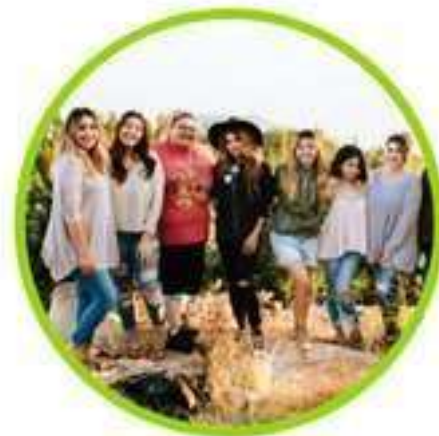
MUJERES Y EQUIDAD DE GÉNERO