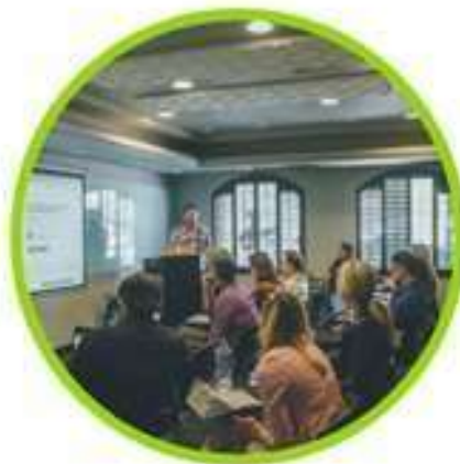
CAPACITACIÓN Y EMPLEO